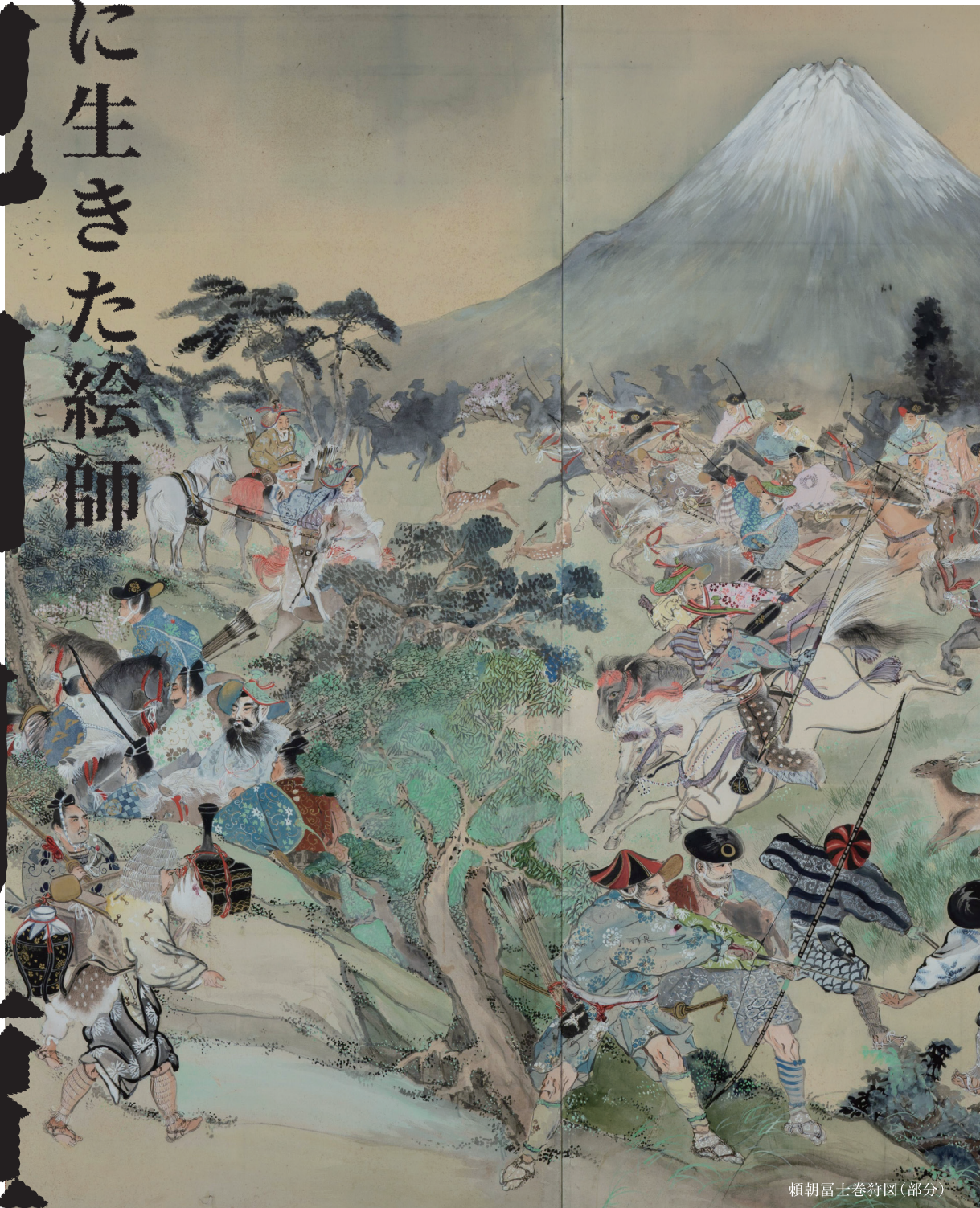
頼朝富士巻狩図(部分)

Artist in the Wild IKEDA GETTAN 100th Anniversary of the Death