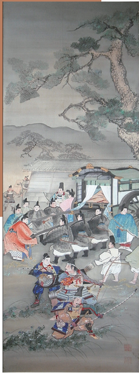
後醍醐天皇笠置山御潜幸図（二幅）