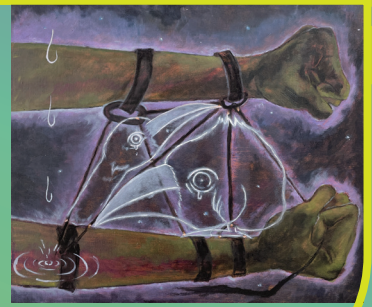
現れるのに勝手はない (つかいはもの魚目) 2021/45.5×53cm/キャンバスに油彩