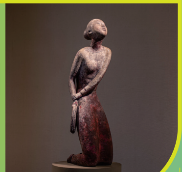
自縄自縛 1975/セメント