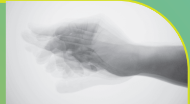
point-point 2021 | 写真